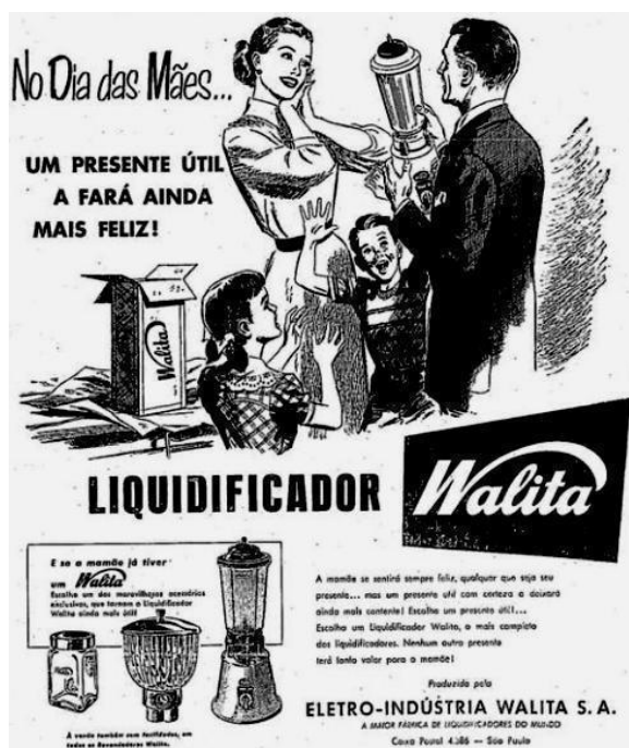
Figura 1 – Propaganda Dia das Mães Walita (1954) 3

estereótipo de mãe foi construído e reforçado através das décadas, reproduzido nos materiais midiáticos, como em propagandas circuladas ainda em preto e branco.