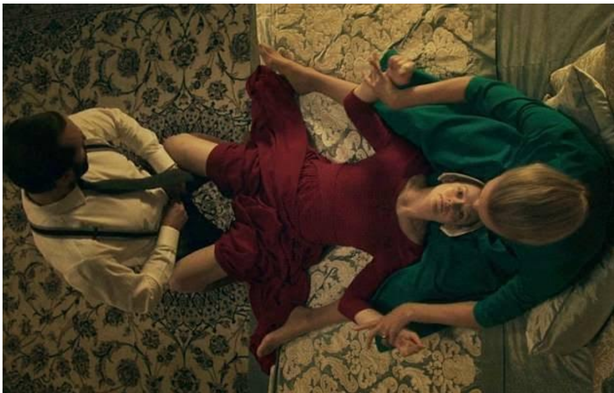
Figura 2 - Cerimônia para reprodução que ocorre em The Handmaid's Tale