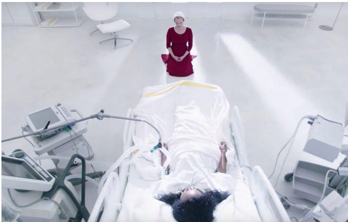
Figura 3 - June de joelhos em frente a maca de Natalie como castigo por ter falhado com sua companheira.