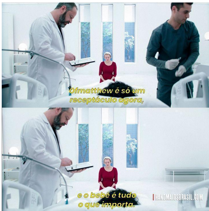
Figura 5 - June confronta médico que atende Natalie