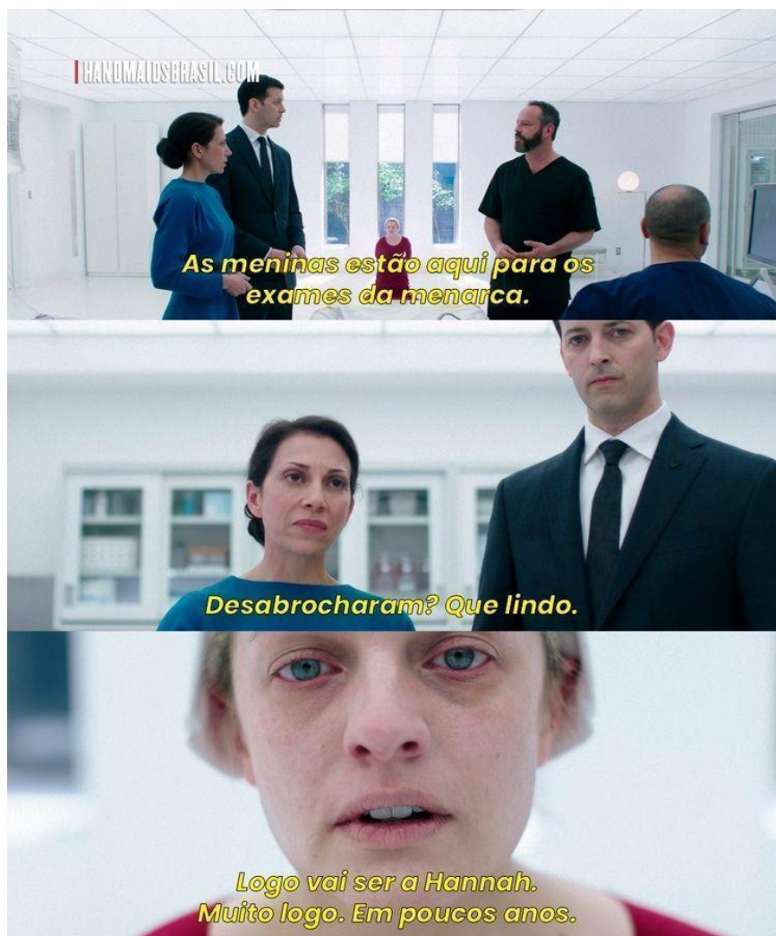
Figura 4 - Esposa e comandante visitam Natalie no hospital