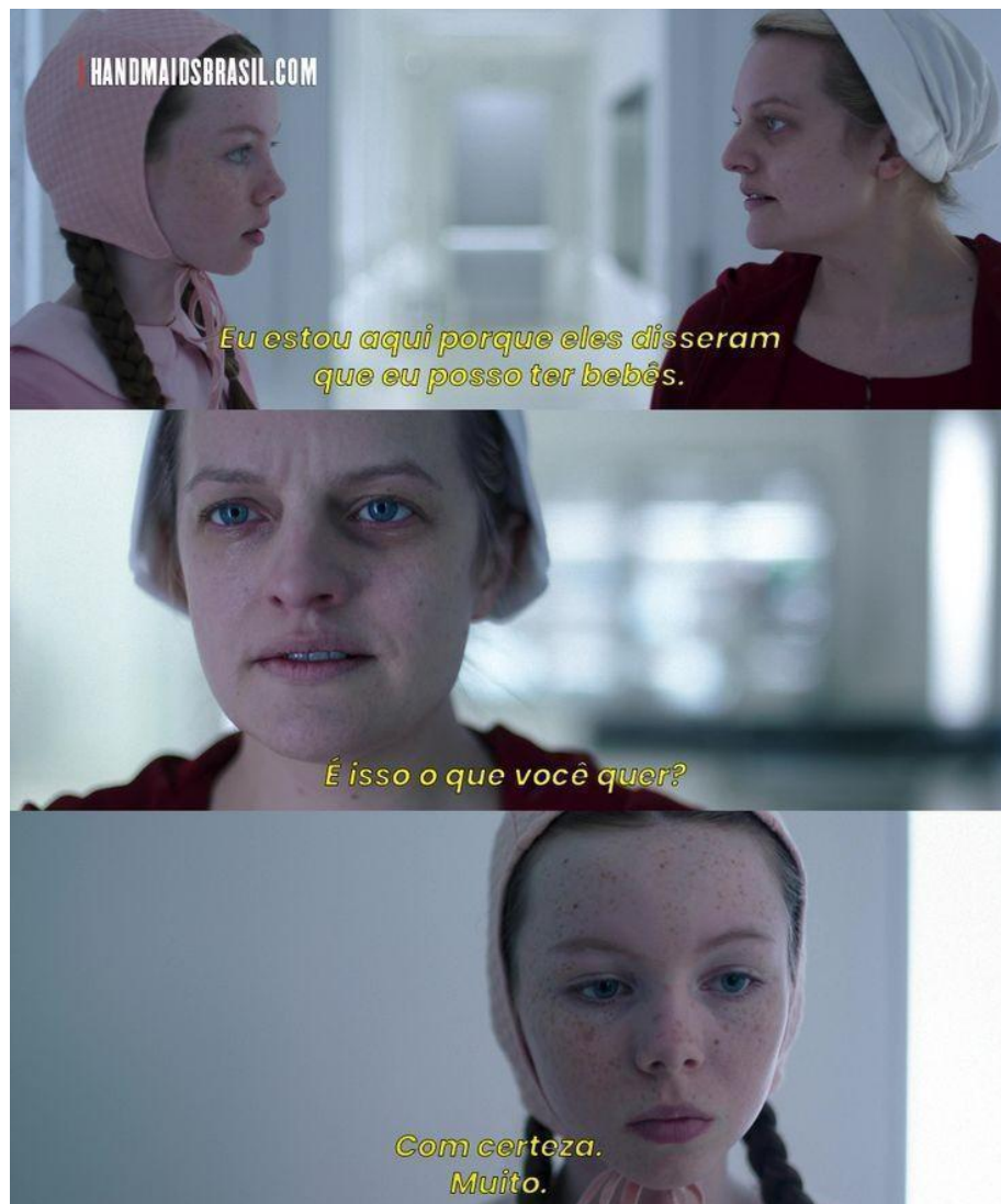
Figura 7 - June encontra algumas meninas no hospital prestes a passarem pelo sistema de Gilead